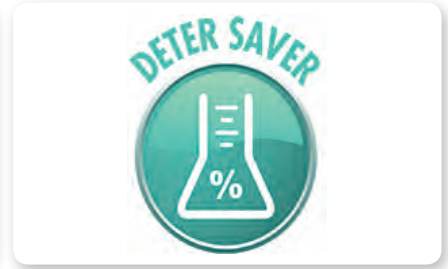
Dosatore detergente on board On board detergent dosing system Dosificación detergente a bordo