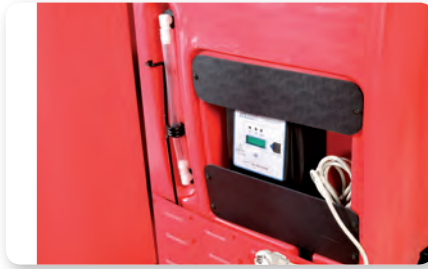
Scuotitore elettrico On-board battery charger Cargador de batería incorporado