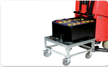
4 Batterie 6V-270 Ah(20h) con cambio rapido Quick-change 4x6V-270 Ah(20h) batteries 4 Baterías 6V-270 Ah(20h) con cambio rápido